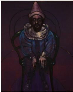
Linares, Joaquín Ezequiel Toulouse Loutrec 1979 Acrílico s/tela 150 x 120cm.

Nace en Buenos Aires en 1927, estudia en la Escuela Superior de Bellas artes “Ernesto de la Carcova”, en 1957 funda e integra el grupo del Sur, en 1960 viaja a Europa becado por el Fondo Nacional de las Artes. En 1962 se radica en S. M. de Tucumán, en 1971 reside en París y en 1980 se radica en Madrid e inicia una galería de personajes latinoamericanos.