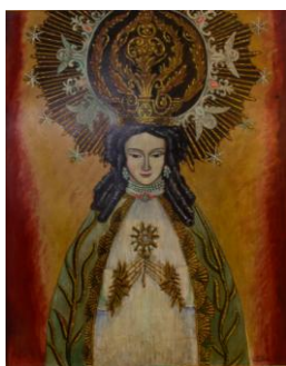
Ache, Alejandro Virgen del milagro 1972 Laca 73 x 88cm.

Fue uno de los pintores radicados en Salta que tuvo gran predicamento entre las familias y comunidades religiosas y civiles de la Provincia. Nació en Beitchebagb, ciudad de El Líbano, en 1898, desde donde parte a la edad de doce años para radicarse en la Argentina junto a su padre. Su primer destino fue Buenos Aires, donde se desempeña como dibujante de la Facultad de Medicina, trabajo que ejerce durante diez años. Allí también se especializa en artes plásticas. Luego de una breve estancia en Córdoba, ciudad a la que se traslada por razones de salud en compañía de su esposa, pasa a radicarse en Salta.