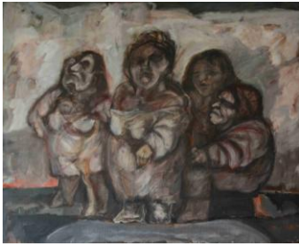
Colombres, Ignacio Serie los condenados de la tierra 1980 Óleo s/tela 130 x 162cm.

Ignacio Colombres es un pintor argentino nacido en Buenos Aires el 22 de marzo de 1917. A partir de la década del '40 y luego de largos estudios con el maestro catalán Vicente Puig, inicia su carrera artística. Comienza a figurar en distintas críticas, con grandes éxitos desde sus 25 años.